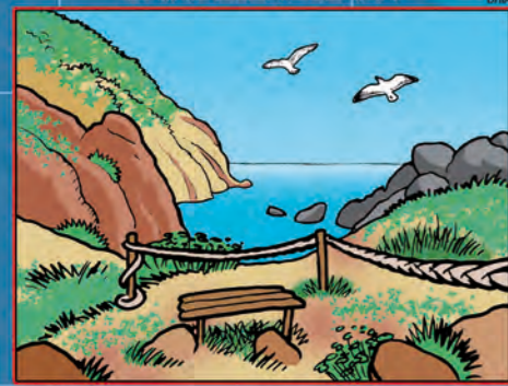
BAIA DELLA PELARA