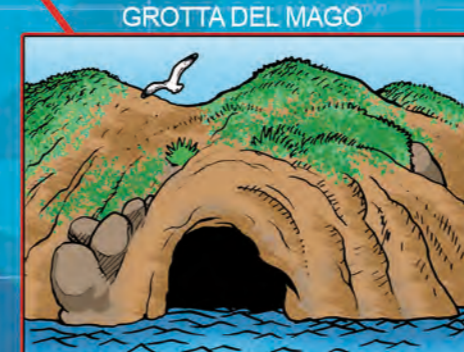
GROTTA DEL MAGO