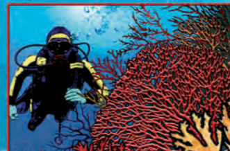
S. ANGELO - PARETE DEL CORALLO NERO

LEGENDA - LIMITI COMUNALI - STRADE PRINCIPALI - STRADE SECONDARIE - SENTIERI