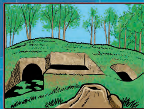
VILLAGGIO RUPESTRE FALANGA